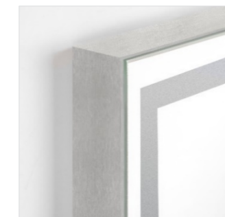
Matt aluminium Aluminium mat