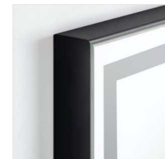
Matt black Noir mat